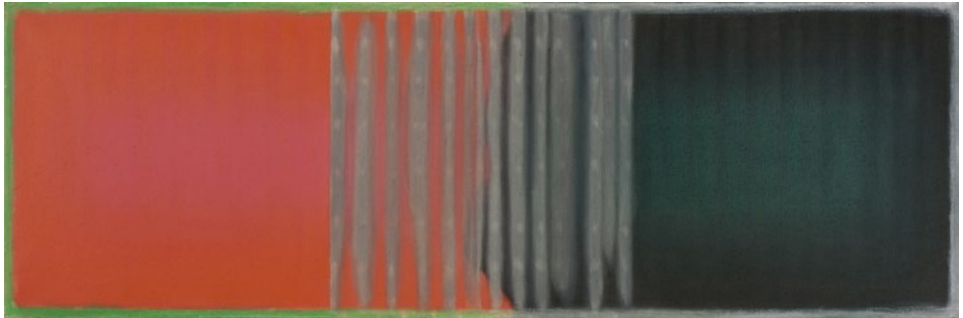
antimaterija, 2008, 40 x 120 cm