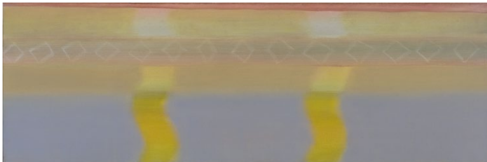
berberland, 2007, 40 x 120 cm

Vključevanje mimetičnih ostalin ali konkretnih upodobitev v prostor slike je pri Birsi običajna strategija, priča o slikarjevem pogumu in vehemenci ustvarjalne imaginacije, najbolj pa po mojem mnenju prepriča takrat, ko v slikovno polje poseže s kakšnim humornim elementom; ko se denimo v horizontalnih pasovih, ki se tako neizbežno povežejo v krajino, horizont, pojavi navpična vijuga, mogoče cesta, ali reka, pogosto v psihedeličnih barvnih tonih. Včasih nastane nekakšna neke vrste nadrealistična humoreska, brez frivolnih podtonov.