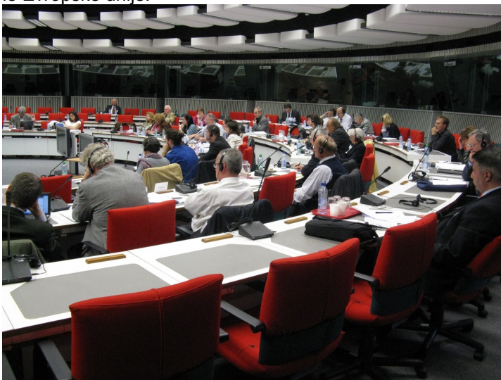
Zasedanje generalne skupščine COFACE

Kot smo že poročali v prejšnji številki glasila je Družinska pobuda, društvo za družini naklonjeno družbo polnopravna članica COFACE, Združenja družinskih organizacij v Evropski uniji. Cilji COFACE na Evropski ravni so podobni ciljem Družinske pobude na nacionalni ravni, to je promocija družinske politike, medgeneracijske solidarnosti in koristi otrok. COFACE soustvarja družinsko politiko na nivoju Evropske unije in se trudi za družinam in otrokom naklonjeno družbo na območju celotne Evropske unije.