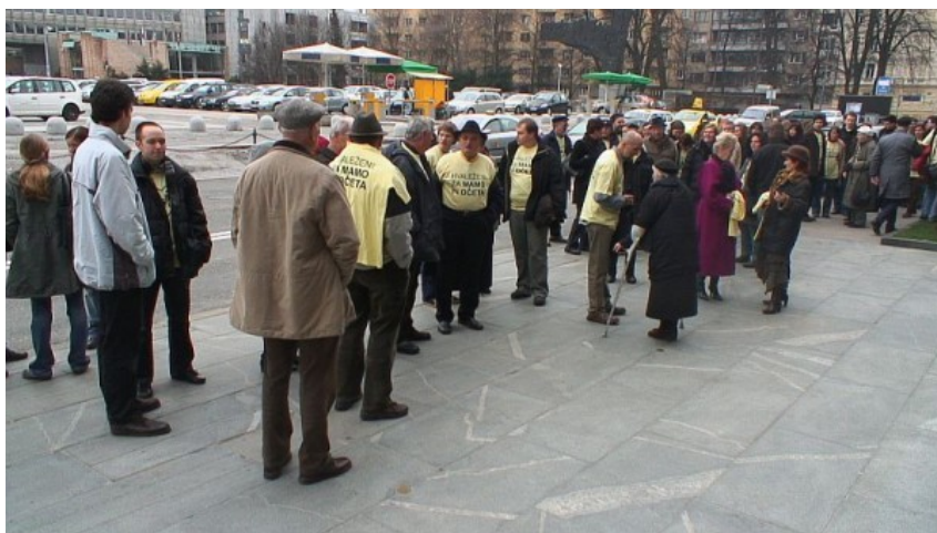
Zagovorniki pravic otrok pred Državnim zborom